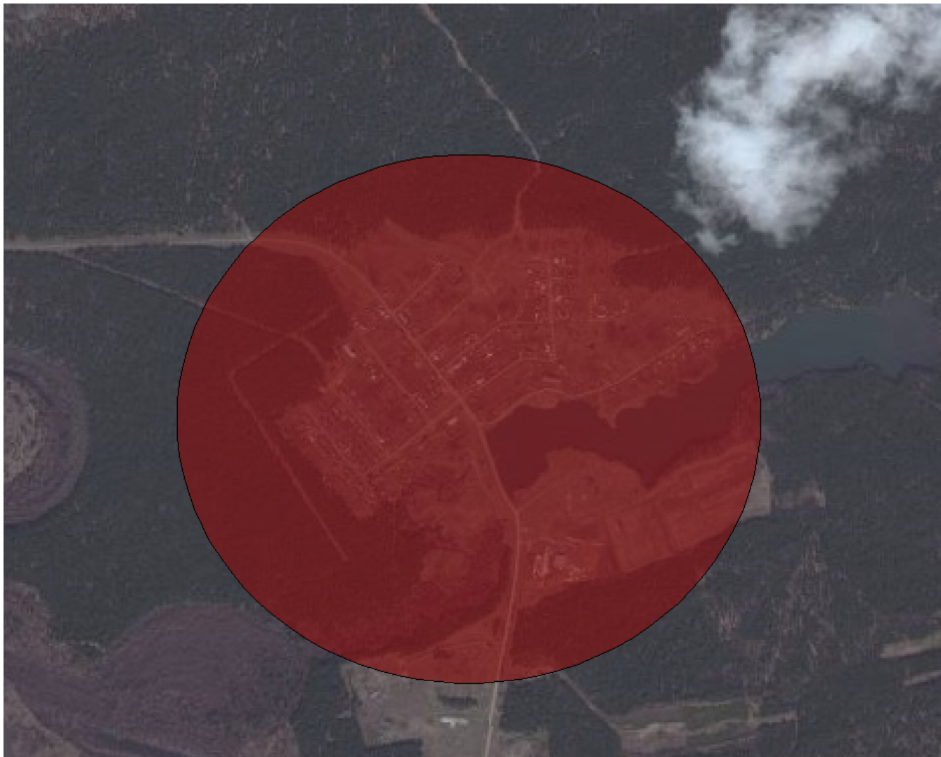
Рисунок 1.1 Радиус эффективного теплоснабжения котельной села Ивановка

Результаты расчета эффективного радиуса теплоснабжения для котельной представлены в таблице 1.3 и на рисунке 1.1