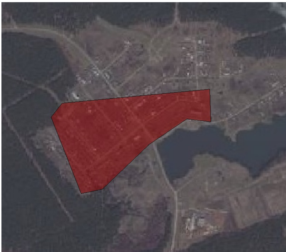
Рисунок 1.2 – Существующая зона действия источника тепловой энергии села Ивановка

Система теплоснабжения села Ивановка состоит из зоны действия одной системы теплоснабжения (п.1.1. Главы 1 «Существующее положение в сфере производства, передачи и потребления тепловой энергии для целей теплоснабжения»), представленной на рисунке 1.2.