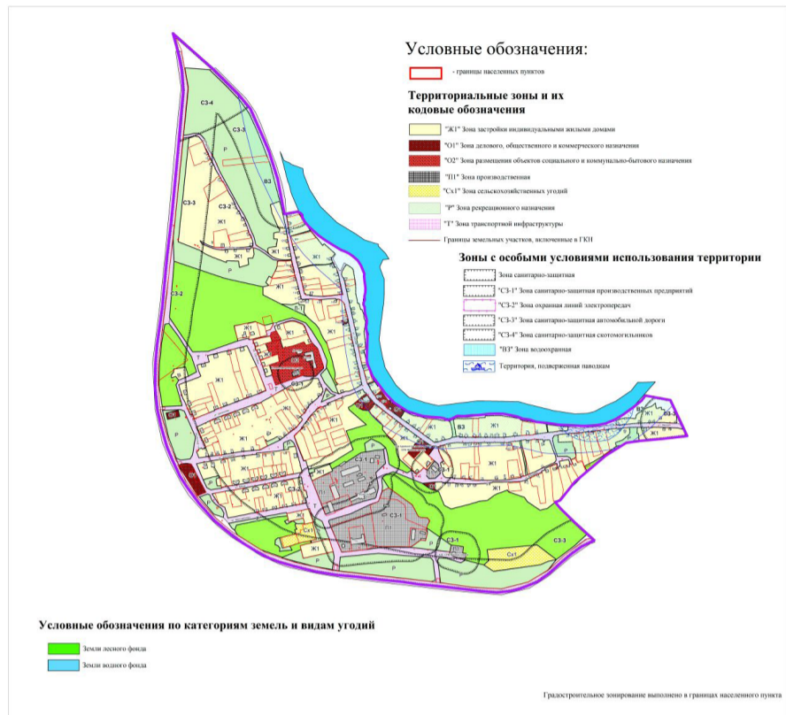
Карта градостроительного зонирования Карта зон с особыми условиями использования территории М1:5000

Условные обозначения по категориям земель и видам угодий Земли государственного фонда Земли муниципального фонда