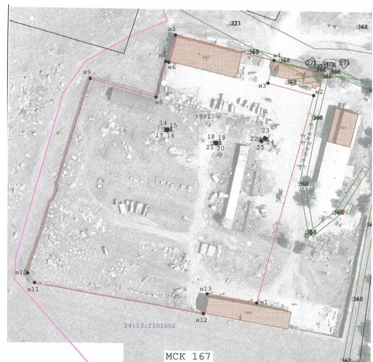
Схема расположения земельного участка с местоположением: Красноярский край, с. Нижний Суэтук, ул. Центральная, 3, стр.2