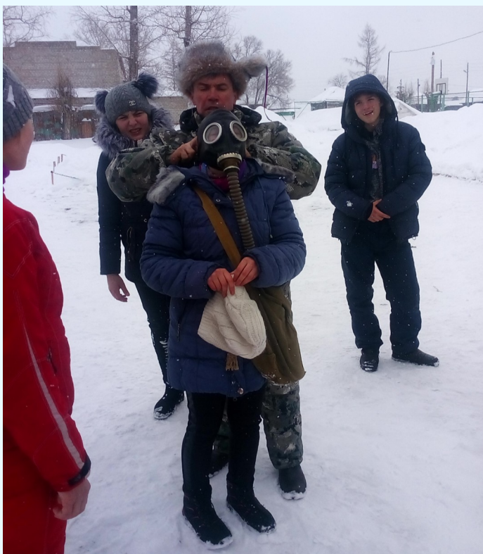
На фото: «Команда—ГАЗЫ!»

Открытие игры было ознаменовано первым испытанием – «Статен в строю, силен в бою», так назывался первый конкурс. Команды продемонстрировали умение ходьбы строевым шагом с песней. В этом конкурсе принимали участие все школьники с первого по одиннадцатый класс. Затем боевые действия учеников среднего и старшего звеньев развернулись на полосе препятствий: «Снайперы», «Газы», «Ориентирование», «Гонки на скорость», «Меткие стрелки», «Разведчики». А младшие школьники с азартом строили снежные высоты, устанавливали знамена, затем с не меньшим удовольствием пытались завоевывать чужие «бастионы», сдергивая ленточки с «неприятеля».