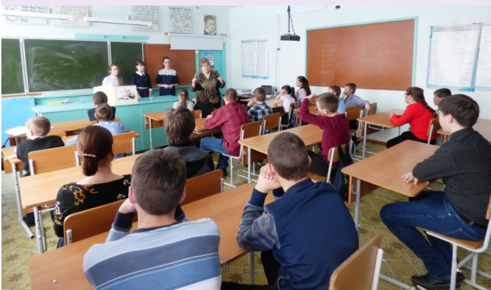
На фото: Урок МУЖЕСТВА в МБОУ «Ойская СОШ»