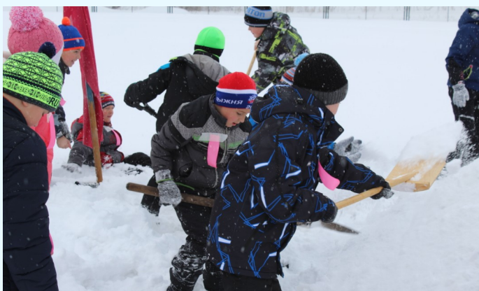
На фото: «Строительство редутов!»