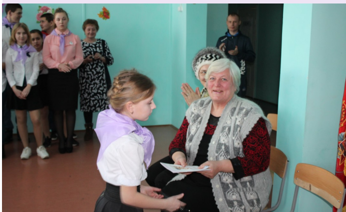
Детско-взрослый коллектив МБОУ «Григорьевская СОШ»

Были приглашены педагоги-ветераны, которым были вручены открытки на память об этом мероприятии. Ветераны выступили со словами благодарности, что напомнили им замечательное время их юности, не могли сдержать слез, пожелали ребятам новых интересных дел и открытий, успехов в учебе.