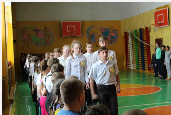
На фото: учащиеся Нижнесуэтульской школы на смотре песни и строя.