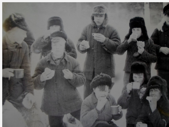
На фото: «На привале, 1968»