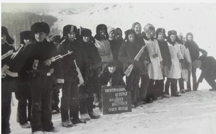
На фото: «В боевой готовности—ЗАРНИЦА!»