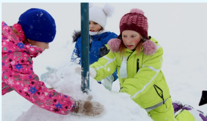
На фото: «Установка флага на редуте»