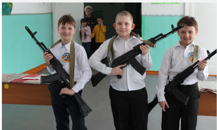
На фото: учащиеся Нижнесуэтульской СОШ на Уроке мужества