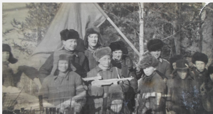
На фото: Зарница, 1972г.

«Зарница» - традиционное мероприятие, которое проводится в Нижнем Суэтуке с шестидесятих лет прошлого столетия, прошла в канун мужского праздника. Это не скучные уроки и не военная муштра, а невероятно интересные состязания, в которых ребята тренируют ум, тело и смекалку.