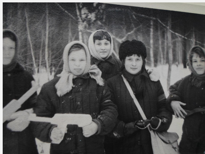
На фото: «Санитарки, 1972»