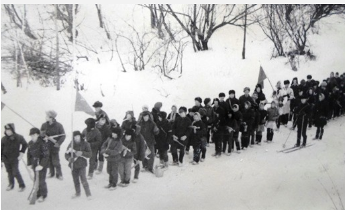
На фото: «Мари-бросок, 1968»